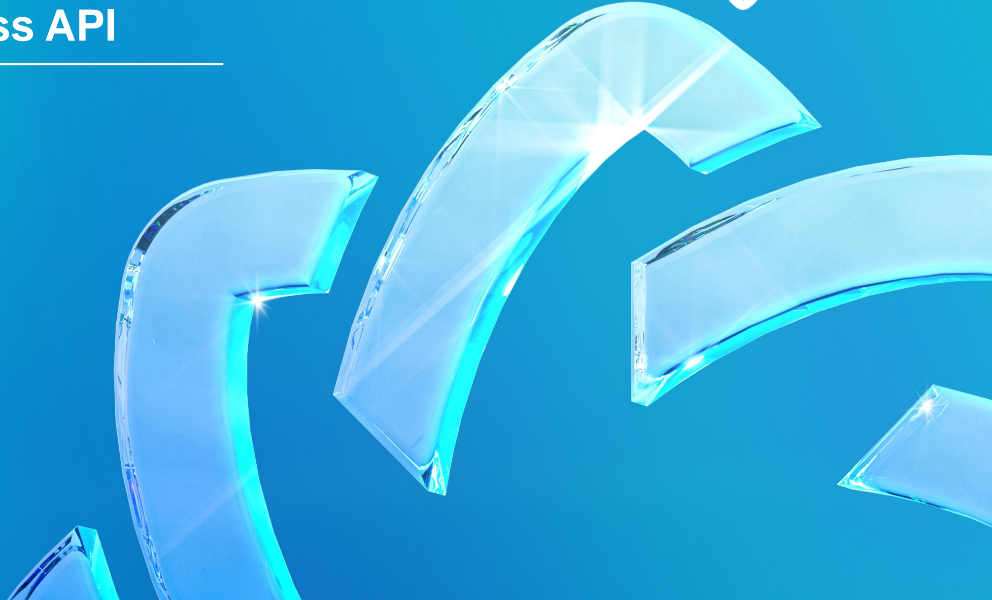
ABB Business API